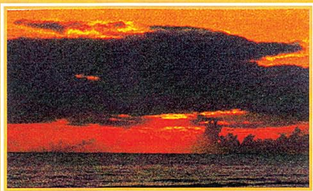
Foto de Paisagem Africana em Angola